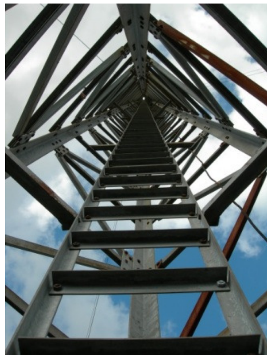
Vista interior de una de las antenas